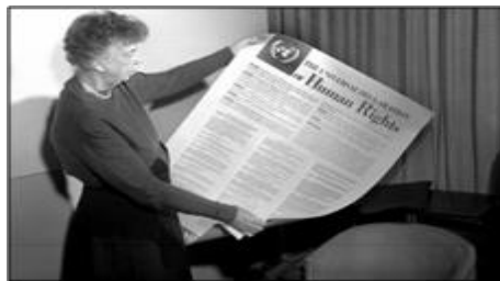
النور روزولت به‌عنوان رئیس کمیسیون حقوق بشر سازمان ملل، عامل اصلی تهیه اعلامیه جهانی حقوق بشر بود.

اعلامیه جهانی حقوق بشر به همراه میثاق بین‌المللی حقوق مدنی و سیاسی (ICCPR)، دو پروتکل الحاقی آن، و میثاق بین‌المللی حقوق اقتصادی، اجتماعی و فرهنگی، در مجموع لایحه بین‌المللی حقوق بشر را تشکیل می‌دهند.