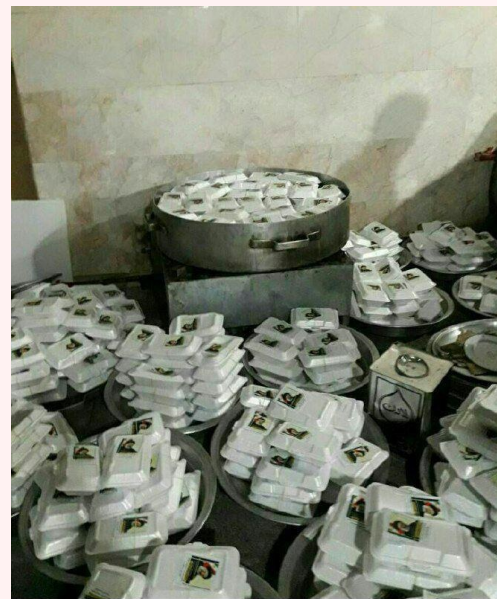
توزیع کمک برای تبلیغات به خودی خود تخلف به شمار نمی‌رود، مگر آن‌که از منابع نامشروع (مانند امکانات دولتی استفاده شده باشد).

در مورد رأی‌دهنده، عدم درک صحیح از روند انتخابات و حقوق انتخاباتی در کنار عدم شفافیت در ساز و کار برگزاری انتخابات یکی از دلائل بدگمانی و بی‌اعتمادی نسبت به روند انتخابات در کشور است. گزارش‌های بیشمار تخلف در رسانه‌ها و شبکه‌های اجتماعی نشان از این بی‌اعتمادی عمومی دارد که