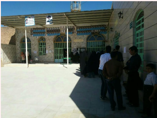
ماده ۷۲ انتخابات ریاست‌جمهوری «هر گونه آگهی و آثار تبلیغاتی باید قبل از شروع اخذ رأی از محل شعبه ثبت نام و اخذ رأی توسط اعضاء شعبه محو گردد.»

بی‌نظمی و مدیریت نامناسب در این انتخابات جنبه‌های مختلفی داشت که برخی از آنها در دوره‌های گذشته نیز دیده شده. به طور مثال بنا به روایت‌های مختلف در انتخابات سال ۱۳۹۶، بین یک تا چهار میلیون نفر موفق نشدند رأی‌شان را به صندوق بیاورند. قوانین انتخاباتی در ایران حکومت را موظف می‌کند امکان رأی‌دادن را برای همه شهروندان مهیا سازد. از این رو رعایت نکاتی چون برنامه‌ریزی مناسب برای توزیع شعبه‌های اخذ رأی متناسب با جمعیت حوزه‌ها، ثبت نام رأی‌دهندگان یا روش‌های جایگزین جهت ارزیابی شمار رأی‌دهندگان در هر حوزه، تهیه برگه رأی به تعداد کافی - نه بیشتر و نه کمتر از حد نیاز، آموزش مناسب اعضای شعبه‌ها، ناظرین انتخابات، نماینده نامزدها و رأی‌دهندگان می‌تواند چنین مشکلاتی را کاهش دهد.